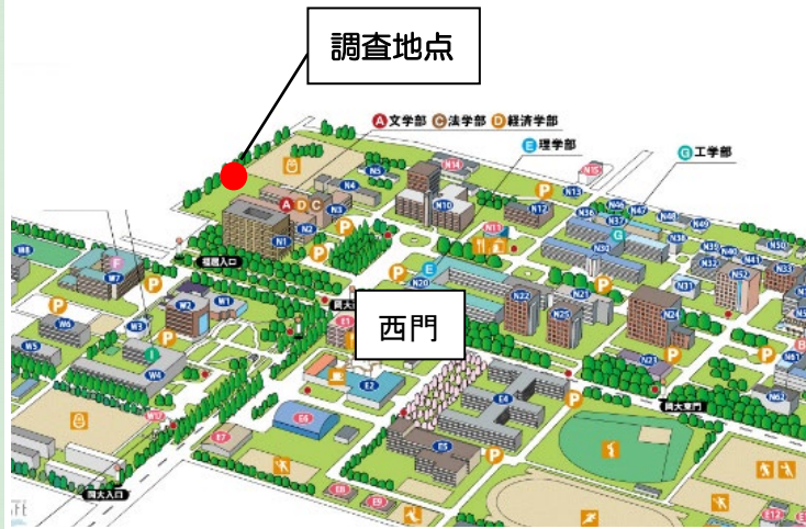
岡山大学津島キャンパス（北地区）