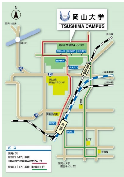
津島キャンパスアクセスマップ