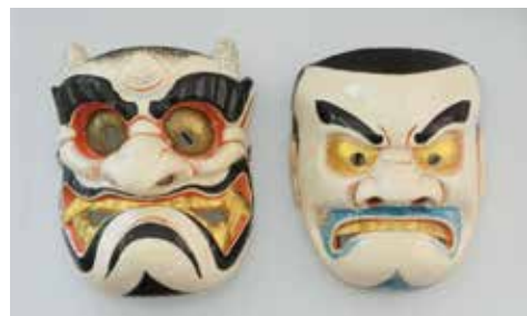
建御名方命面・素戔鳴尊面(高梁市指定重要文化財、個人蔵)