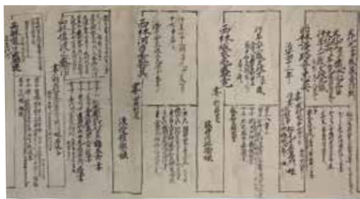
西林家系図(個人蔵)