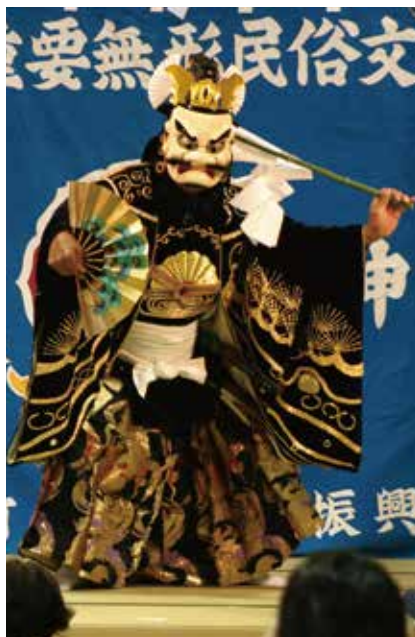
素戔鳴尊(大蛇退治)

この展覧会では、神楽に関する古文献、神楽面、衣装などの各種資料により、「備中神楽」の歴史をわかりやすく紐解きます。また、平成30年豪雨により倉敷市真備町で被災したものの修復された西林国橋に関する古文献も初公開します。