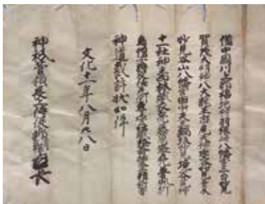
西林国橋の神道裁許状(個人蔵)