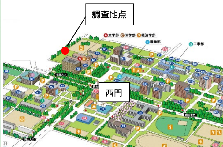
岡山大学津島キャンパス（北地区）