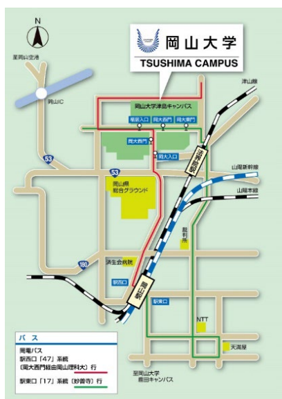
津島キャンパスアクセスマップ